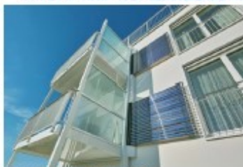
Wetzlar, Waldgirmeser Straße 22-24