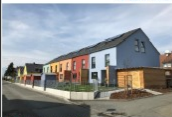
Wetzlar, Hermannstraße 22-30, Neubau von Familienreihenhäusern