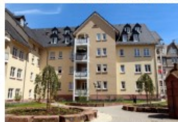
Wetzlar, Amsturger Gasse 1