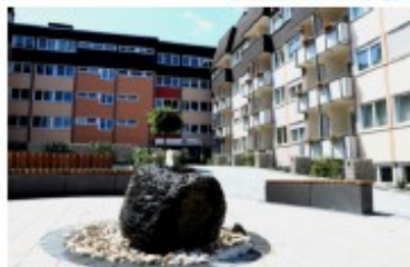
Wetzlar, Pariser Gasse 3