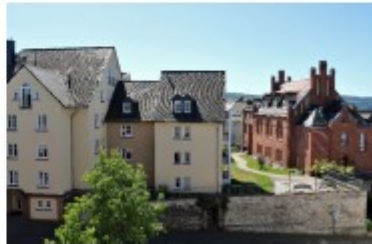
Wetzlar, Amsburger Gasse 1