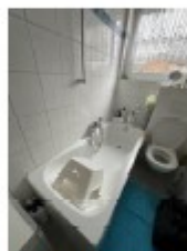
Am Sturzkopf 13