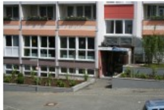
Wetzlar, Pariser Gasse 3