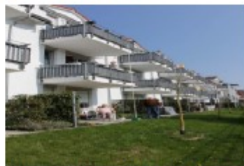
Wetzlar-Hermannstein, Schulstraße 3/ Hofstadtstraße 2