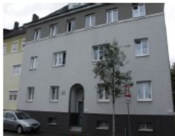
Wetzlar, Formerstrasse 80