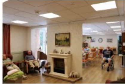
Wetzlar-Naunheim, Lahnstraße 3