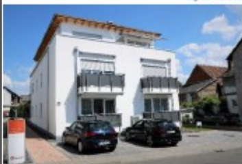
Nauheim, Lahnstr. 3