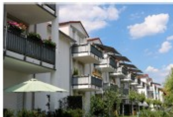
Wetzlar-Hermannstein, Schulstraße 3/ Hofstadtstraße 2