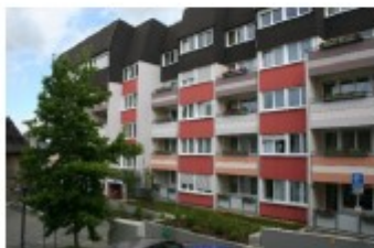
Wetzlar, Pariser Gasse 3