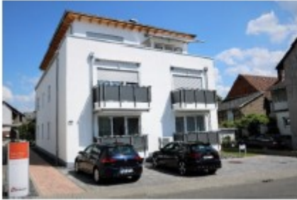
Wetzlar-Naunheim, Lahnstraße 3