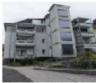
Wetzlar, Formerstrasse 80