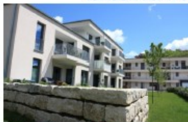
Wetzlar, Taurusstraße 5-7, Projekt Weiter Raum