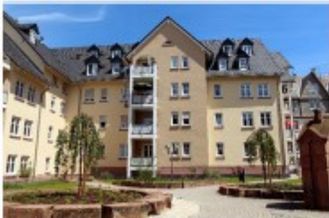
Wetzlar, Amsburger Gasse 1