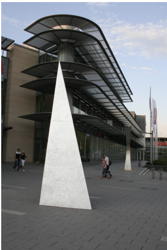
Stroboskop am FORUM