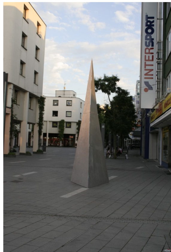
Lichtleiter in der Bahnhofstraße