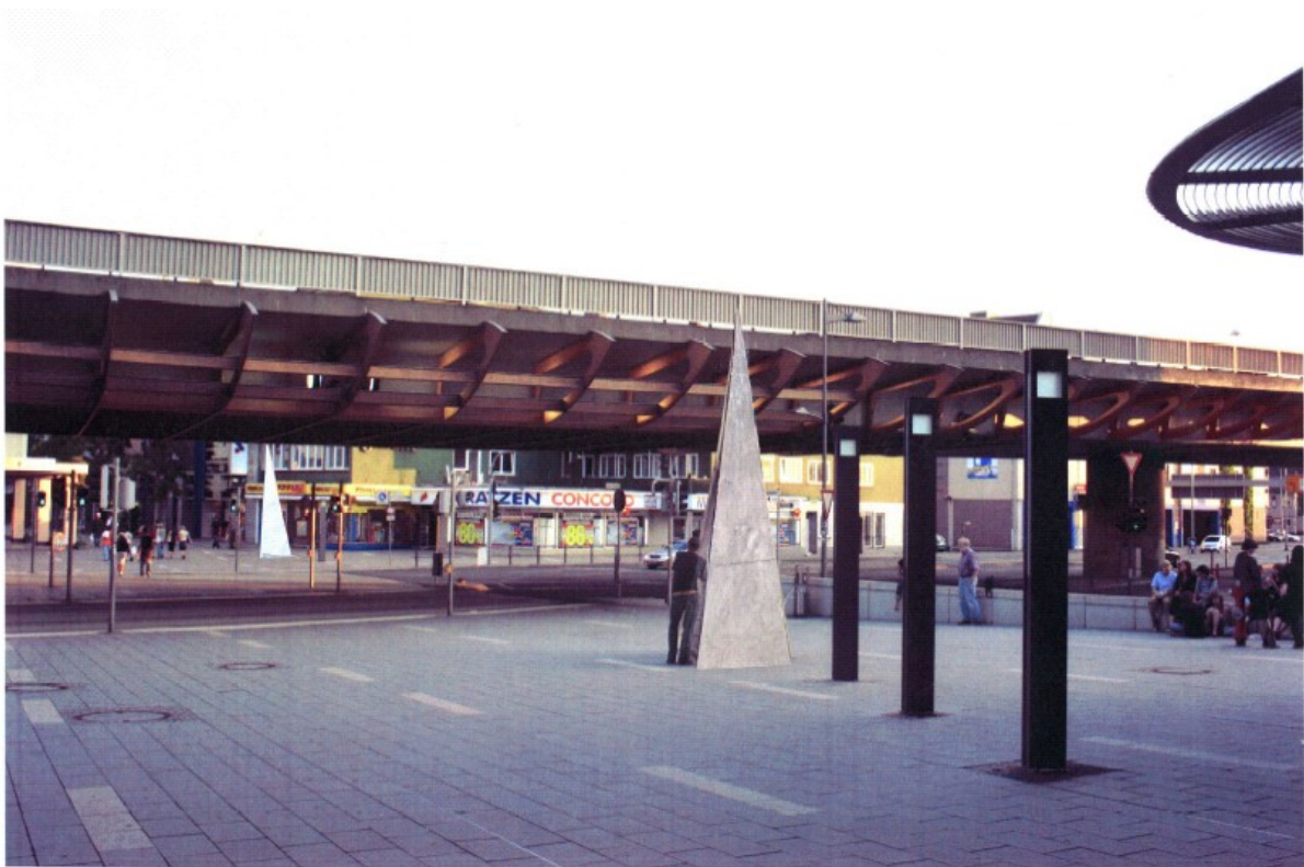
Blick vom FORUM in die Bahnhofstraße.