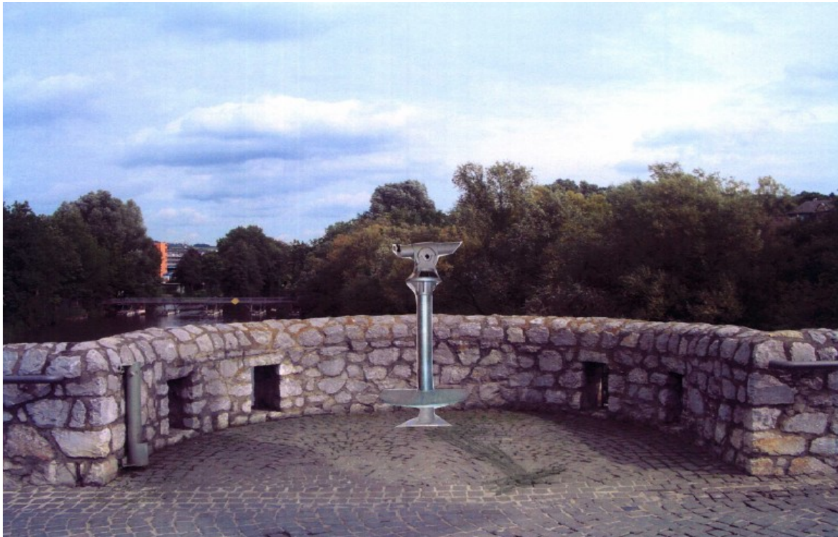
Neuer Standort für das Nachtsichtgerät auf der Alten Lahnbrücke.